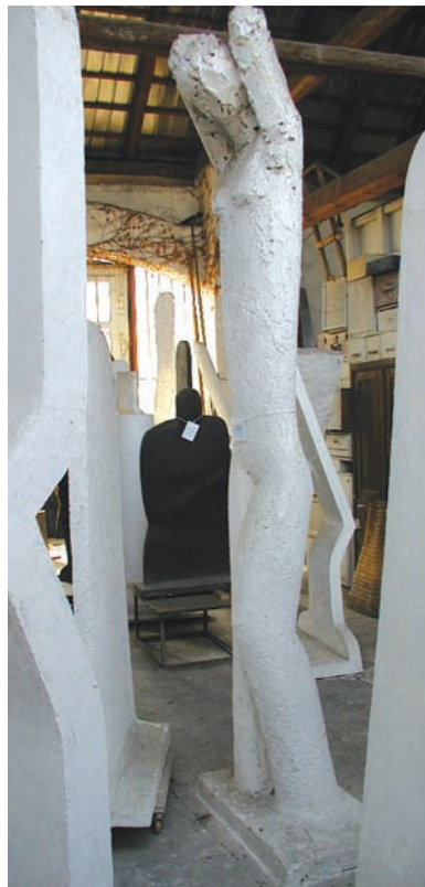
Múza, jak se nazývá socha Zdeňka Palcra, čekající na svou instalaci nad vodními schody, je skvělým výsledkem sochařova hledání krásné figury. Je postavou v archetypálním tvaru křehké ženské, až múzické krásy.

Zmínil jste se o prozatímním dokončení parku. Znamená to, že ještě dojde k nějakým změnám? Jedna ze čtenářek Brněnského Metropolitanu na-