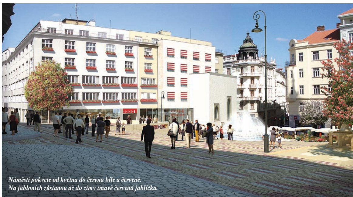
Náměstí pokvete od května do června bíle a červeně. Na jabloních zůstanou až do zimy tmavě červená jablílka.